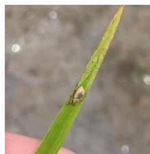
イネミズゾウムシ