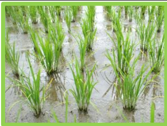
【中干し開始の目安の株】