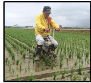
乗用溝切機を使用した溝切りの様子