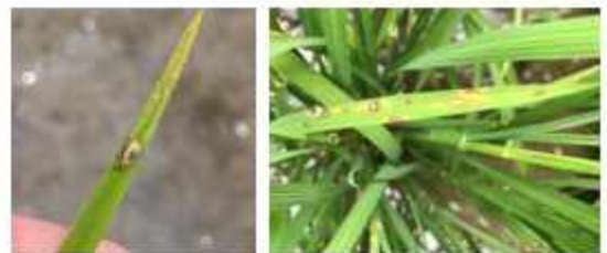
イネミズゾウムシ