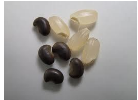
クサネム種子(黒い粒:左)

・クサネムの種子(右の写真)は、ライスグレーダーで取り除けないため、異物混入で落等の原因となります。